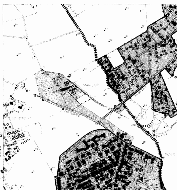
STALCIO AREA 1

CENTRO ABITATO PRODUTTIVO ASSIMILATO (in quanto stabilmente usato in modo promiscuo)